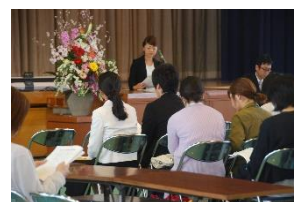
【昨年度の総会の様子】

また、授業参観の後、体育館で「PTA総会」「学校説明会（令和2年度坂部小学校の教育について）」が行われます。よろしくお願ひします。