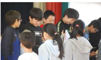
～1年生から6年生へ プレゼント!～

6年生からは、嵐の「Turning up」のダンスが披露されました。難しいステップも見事でした。