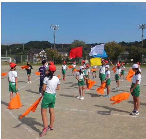
団体演技の練習から（高学年）