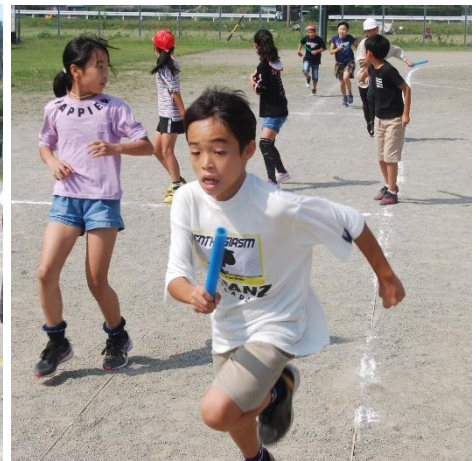
休み時間にリレーの練習に励む子供たち（上記3枚）