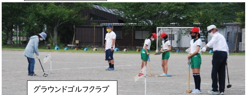
グラウンドゴルフクラブ