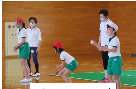
バウンドテニスクラブ

講師の先生方の温かな御指導のもと、子供たちは楽しく活動しています。教えていただいたことを生かして上達しようという子供たちの「チャレンジする」姿が見られます。