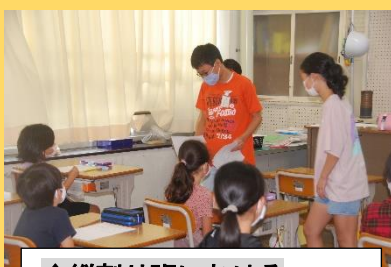
↑縦割り班における 目標決めの様子