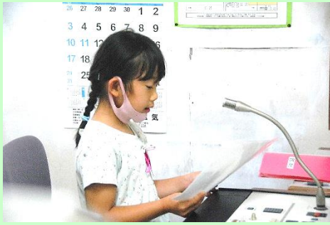
前期終業式で、代表の言葉を述べる子供たち(放送室にて)