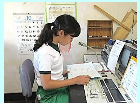
後期始業式で、代表の言葉を述べる子供たち(放送室にて)