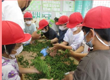
3年生 手もみ茶体験